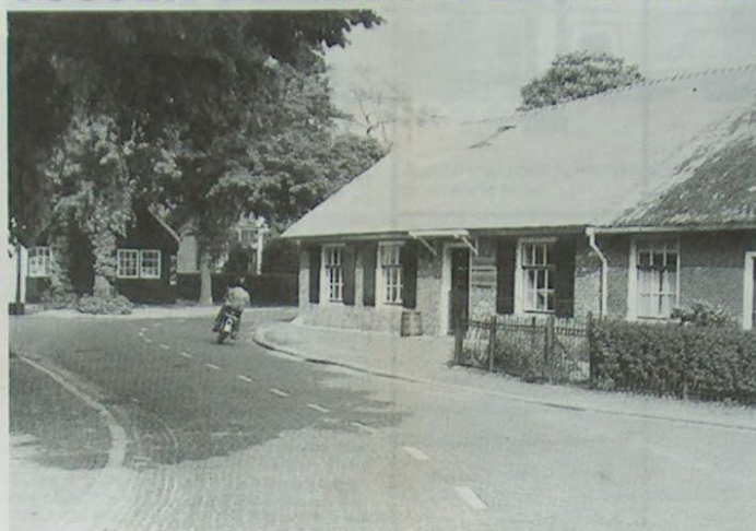
En mooi beeld uit het hart van ons dorp.